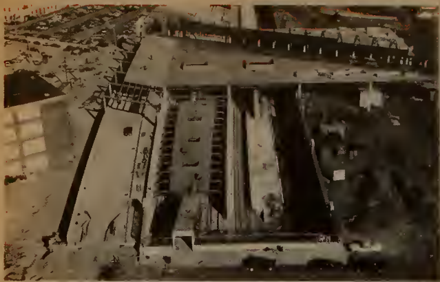
Ruggles St. entry way of Ruggles Street Station, showing transit and railroad platforms and busway (left)